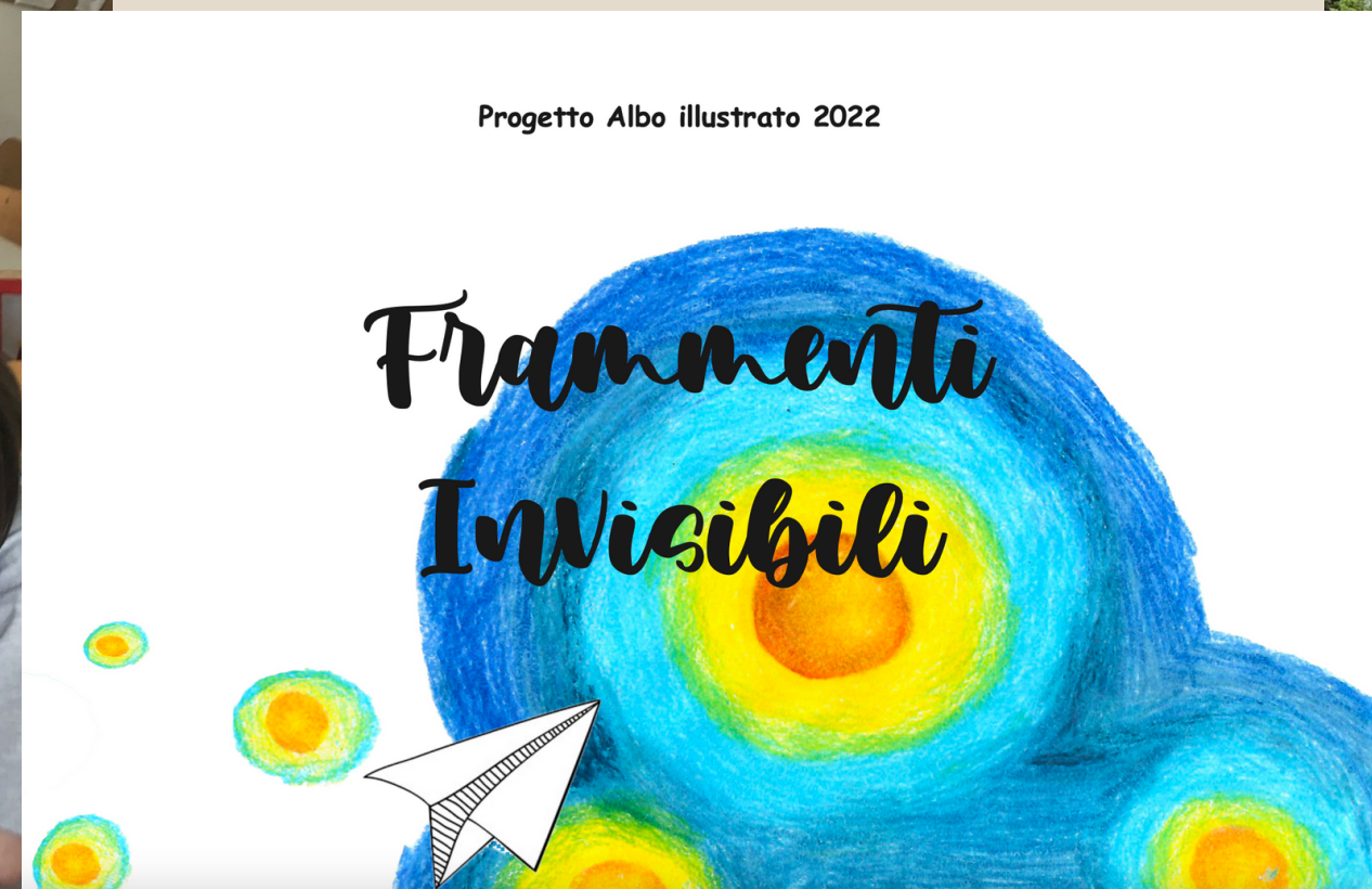
ad un progetto comune