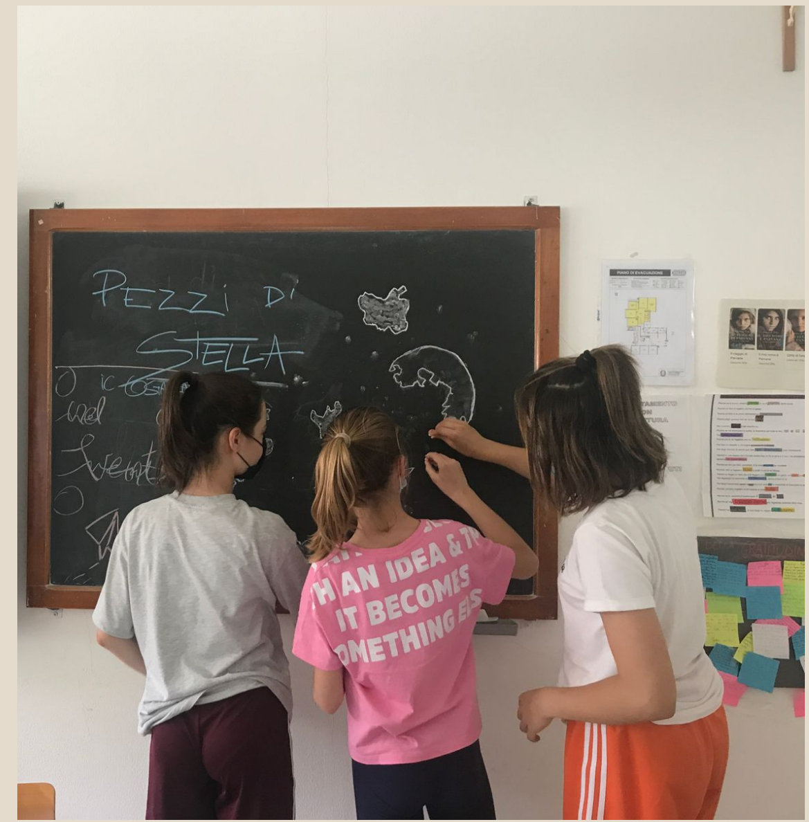
ma si lavora sempre insieme divertendosi