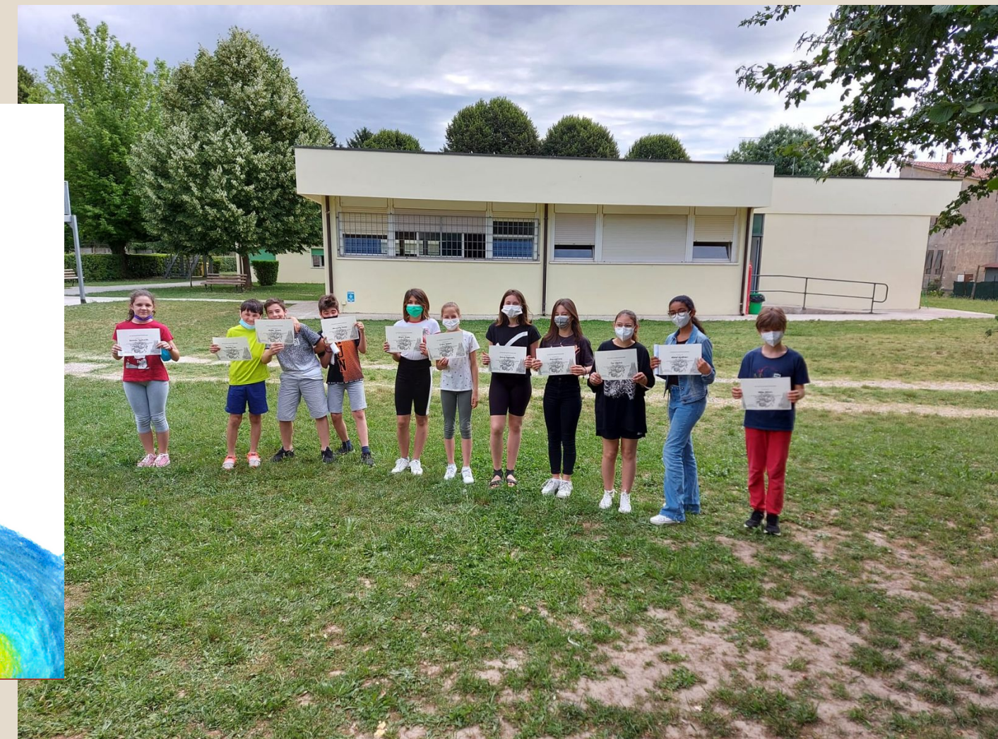
felici del risultato ottenuto.