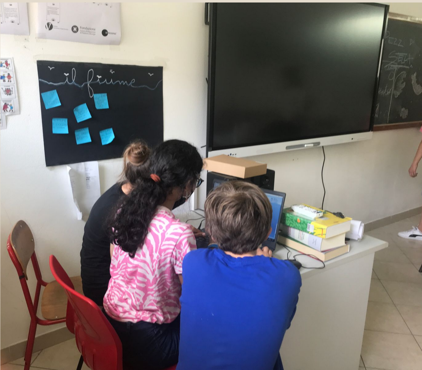
C'è chi scrive

Esperte • Brainstorming • Fasi di lavoro