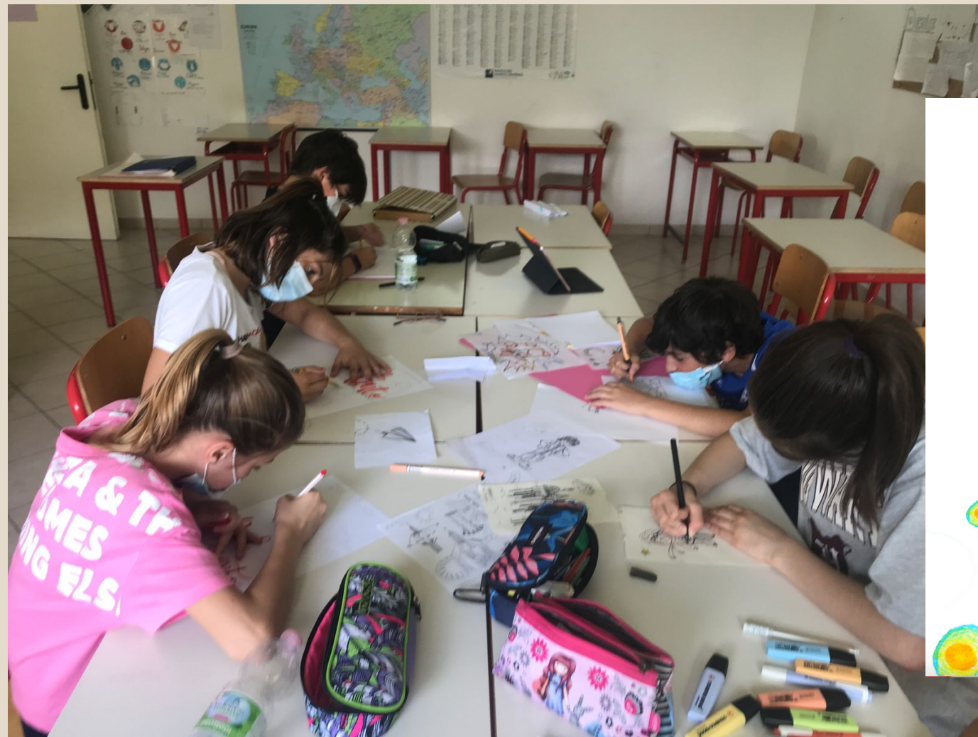
Ragazzi entusiasti di lavorare insieme