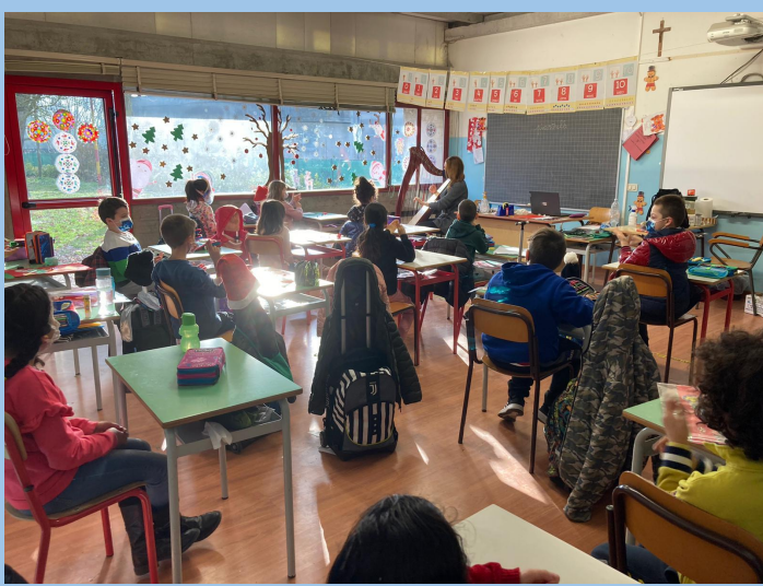
alcuni plessi della Scuola Primaria durante le lezioni d'arpa